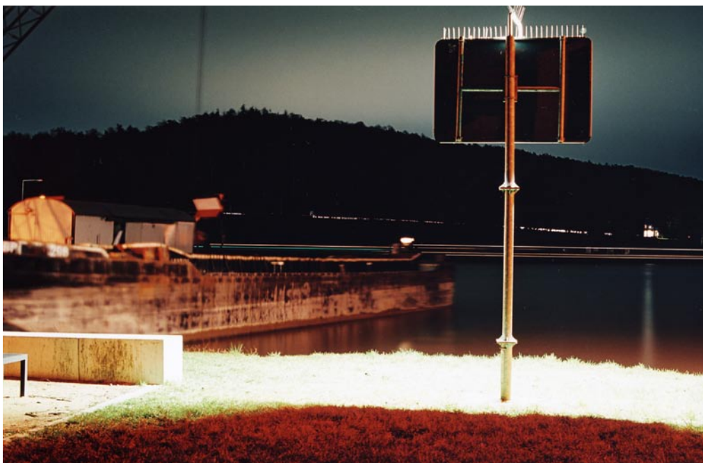
aus der Serie Ibbenbüren , 2007 C-Print 13cm x 18cm