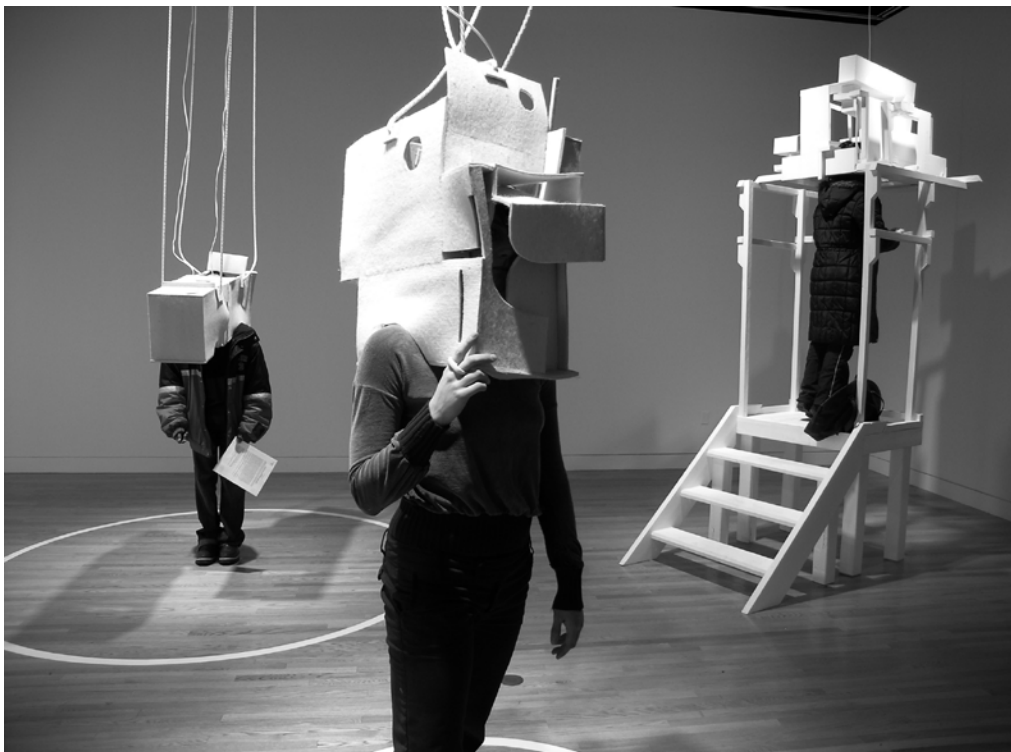
Plastic Optimism: A Practice in Enabling Constraints, 2009 Variable, Felt, mini-speakers, LCD screens