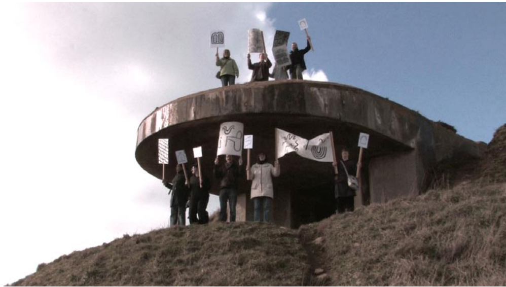
Still aus La civilization horizontale , Essayfilm, 2011 HDV, 17min 36sec