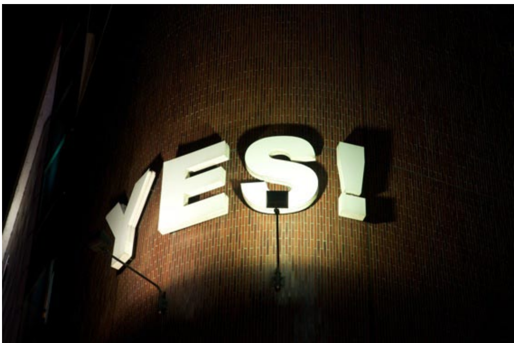
Beispielfoto aus Do You Read Me? , 2011 Video, Photobuch und Photoserie