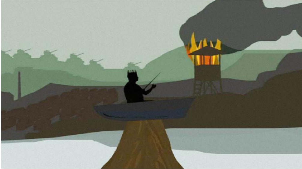
STAGNATING WATER, 2010 Filmstill aus Videoinstallation DVD, loop, 3min 35sec