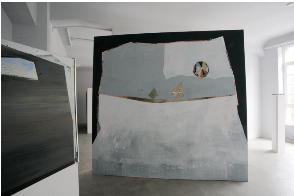
Platzhalter , 2011 Rauminstallation im Vordergrund: Holzelement und vier Gemälde Gesamthöhe 180cm im Hintergrund: Mischtechnik auf Leinwand 287cm x 300cm