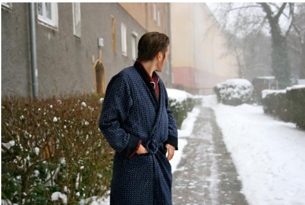
Becoming 10 , 2010 Fotoinstallation (Detail) 27 Fotos, 9 davon gerahmt 20m x 3m